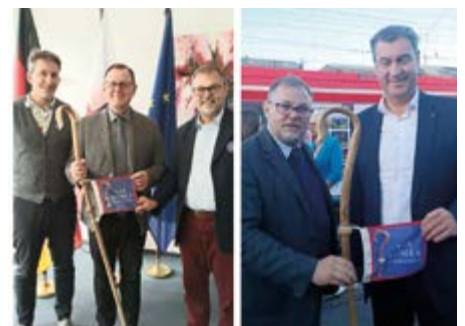
Ministerpräsident Thüringen, Bodo Ramelow