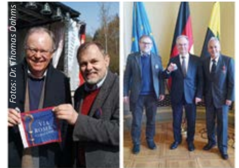
Ministerpräsident Niedersachsen, Stephan Weil

zu überwinden. Unterschiedliche Kulturen in ihrer Eigenart wert zu schätzen, aber auch durch die Erkenntnis gemeinsamer Traditionen und Werte ihre Völker neu zu verbinden, und dabei möglicherweise, sich selbst, also die eigene spirituelle oder humane Identität zu finden.“